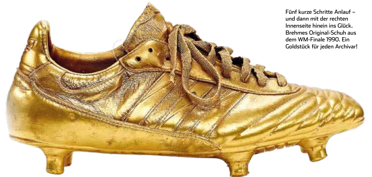
Fünf kurze Schritte Anlauf – und dann mit der rechten Innenseite hinein ins Glück. Brehmes Original-Schuh aus dem WM-Finale 1990. Ein Goldstück für jeden Archivar!

GR: „Tooooo für Deutschland, 1:0, durch Andreas Brehme. Alles wie gehabt. Mit rechts flach ins linke Eck. Goycochea wusste alles – nur halten konnte er ihn nicht.“