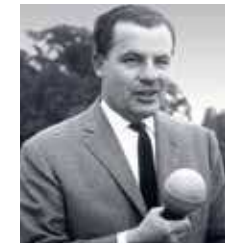
WM-FINALE 1954 IN BERN DEUTSCHLAND GEGEN UNGARN 84. MINUTE, SPIELSTAND 2:2 KOMMENTAR: HERBERT ZIMMERMANN

Mit Wucht ins linke untere Eck! Mit diesem Schuh erzielte Helmut Rahn in Bern das 3:2. Heute lagert er im adidas Archiv –wie eine Skulptur, in Bronze gegossen.